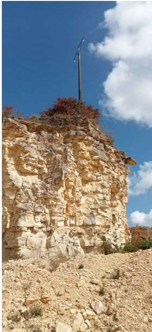
La pierre en surplomb est au centre et à droite du front.

8) Comme l'avait relevée la précédente inspection (9 novembre 2021), une pierre en position de surplomb, située sur un front sous la ligne électrique, menace son environnement en cas de chute (voir photographie ci-dessous). Le périmètre au sol et à l'aplomb du front a été sécurisé par une limitation d'accès au moyen d'un merlon. Néanmoins, le sous-cavage du front constitue un risque permanent de déstabilisation de la pierre, avec un effondrement ou un éboulement possible.